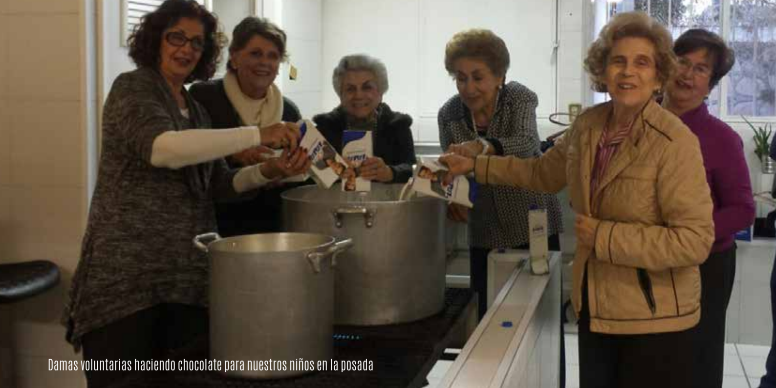
Damas voluntarias haciendo chocolate para nuestros niños en la posada